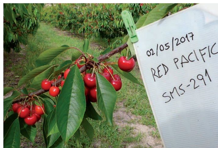
Las variedades de cereza Nimba y Red Pacific, se enmarcan en el grupo de fruta precoz, y en campo han presentado un buen nivel de azúcar y firmeza en la carne. / VF