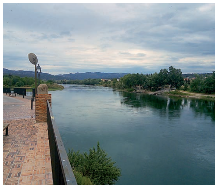
El anteproyecto de aumento de zona regable de momento está parado. / JDC