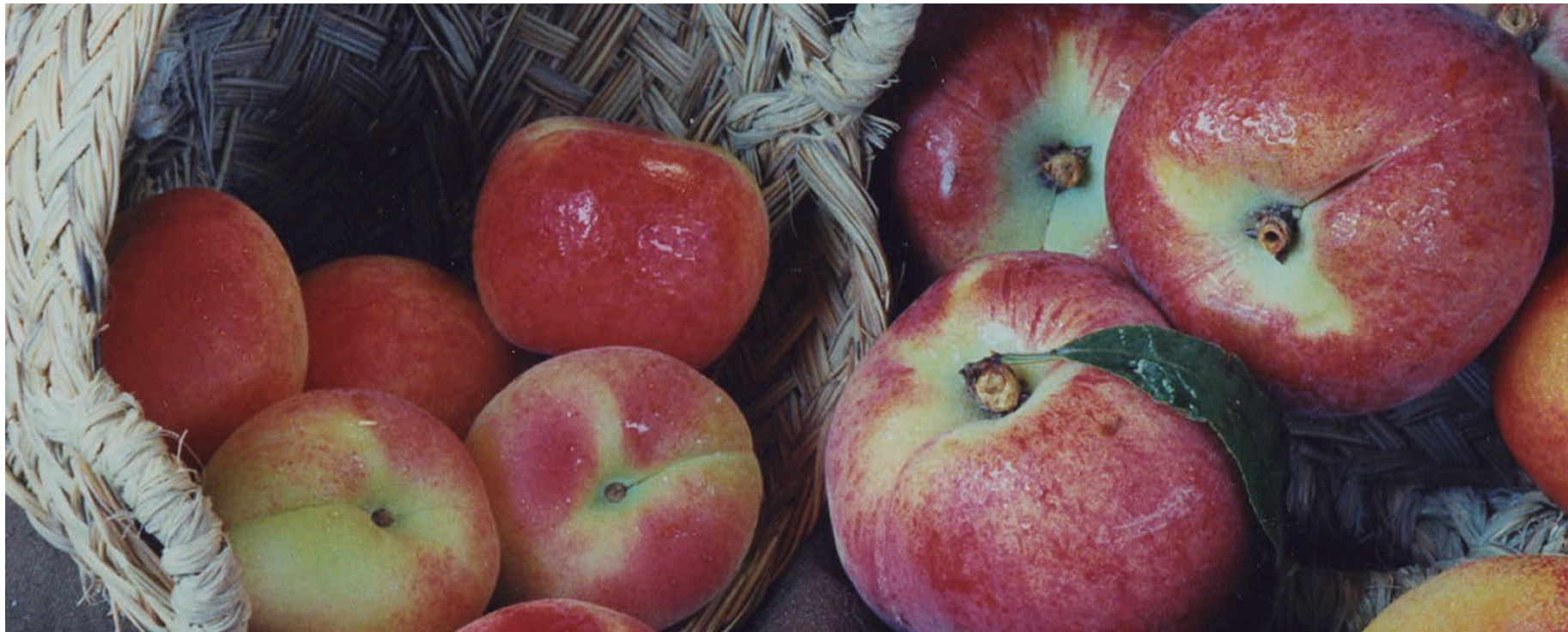
En las nuevas plantaciones que los productores de fruta de hueso de Benissanet están realizando, se está apostando por variedades de nectarina de carne amarilla.