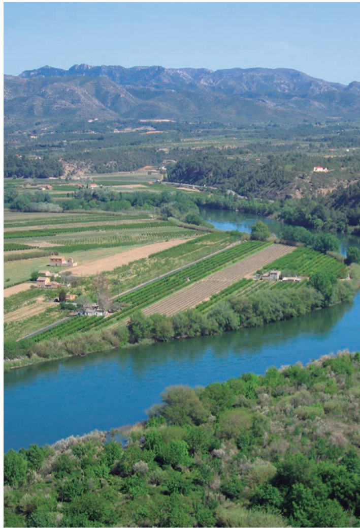
Las buenas condiciones meteorológicas permiten ser optimistas este año.

No hay que olvidar que la figura del pequeño agricultor y productor está muy presente en el campo de la comarca de Ribera d'Ebre. La gran mayoría de ellos son partícipes del reconocimiento de la fruta de la Ribera d'Ebre por