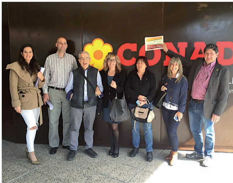
La comitiva antes de viajar a Italia y Austria para las misiones comerciales de 2016.

El pasado año 2016 se realizó el quinto viaje de prospección comercial desde que en 2011 se comenzó a trabajar con el sector de la fruta dulce. En el año 2012 se exploró el mercado de Holanda; en 2013, Rusia; en